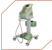
Eyelight Dry Eye Treatment, Italy