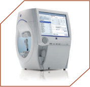
Zeiss Humphrey Field Analyser HFA-3, Germany