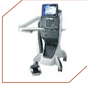
Alcon Constellation Vision System, USA