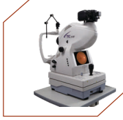
Fundus Camera By Topcon, Japan