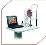
Corneal Topography By Oculus