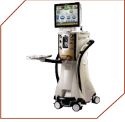
Alcon Centurion Vision System, USA