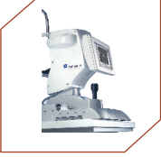
Zeiss IOL Master, Germany