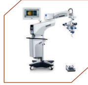
Zeiss Lumera - I operating microscope, Germany