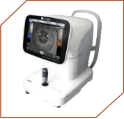
Tomey Specular Microscope