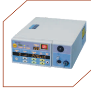
Green Laser Photocoagulator Cyc 1000, Nidek, Japan